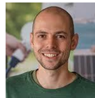
TKI Urban Energy