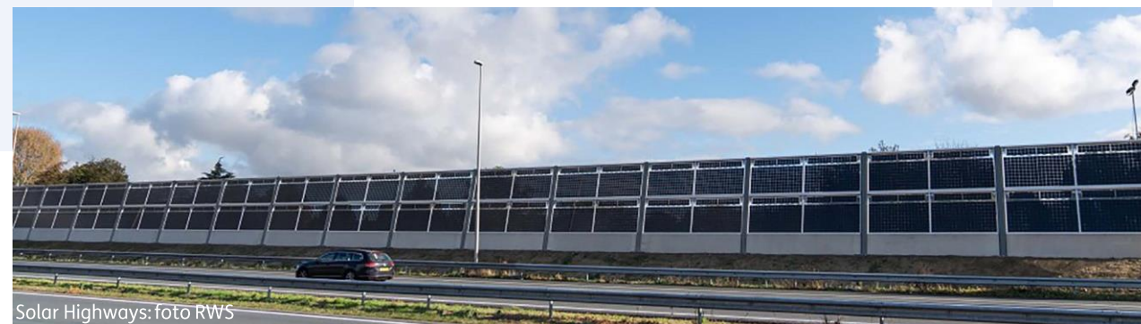
Solar Highways