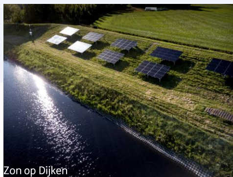
Zon op Dijken